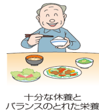
十分な休養と バランスのとれた栄養