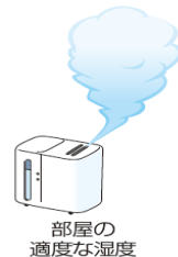
部屋の 適度な湿度

インフルエンザは、主に、咳やくしゃみの際に口から発生する小さな水滴(飛沫)によって感染します(飛沫感染)。普段から“咳エチケット”(①他の人に向けて咳やくしゃみをしない、②咳やくしゃみが出るときはマスクをする、③手のひらで咳やくしゃみを受け止めたなら手を洗うことなど)を心がけてください。