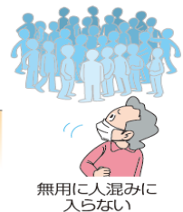
無用に入混みに 入らない