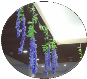
5月は藤の花の工作をしました。

デイサービスでは、4月中旬より今まで以上にご利用者様のニーズに対応できるようにフロアを二つに分け、サービスの質の向上を目指しています。フロアごとに分かれてサービスを提供することで個別に重視したケア、レクリエーション、リハビリなどに取り組んでいます。 コロナウイルスの感染予防については手洗い、うがい、手指消毒、フロア内の換気、テーブル、椅子、手すりなどの消毒、マスクの着用などを実施しています。 座席は、三密（密閉、密集、密接）を避ける為にテーブルや座席の間隔を広くとり、皆様が安心して利用できる環境設定をしています。