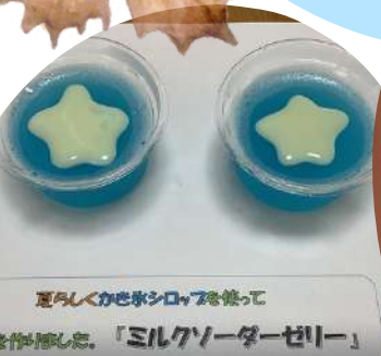
夏らしくかき氷シロップを使って作り出した、「ミルクソーダーゼリー」

栄養課にて毎月手作りのおやつ提供を行っています。7月はアモール畑で利用者様に収穫して頂いたトマトで作ったトマトゼリーとコーヒードリンク、8月はミルクソーダーゼリーを召し上がって頂き、「美味しい」と喜んでおられました。