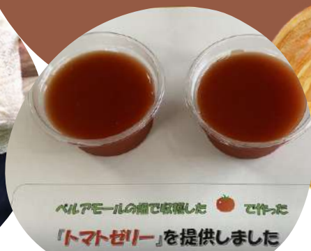
ベルアモールの畑で収穫したトマトで作った「トマトゼリー」を提供しました